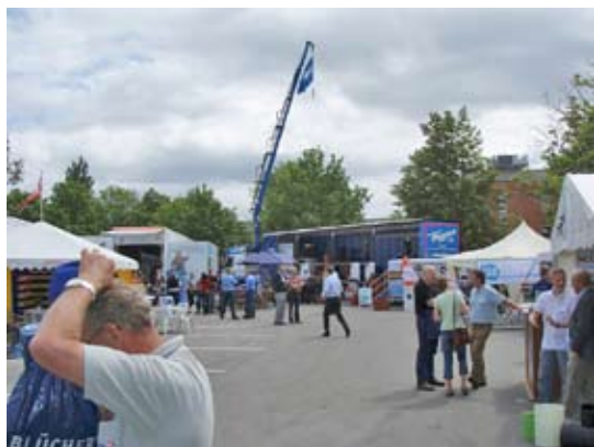
Uponors stand med kran

Som afslutning på dagen ville DANPIPE A/S være værter ved et godt måltid mad, inden vi skulle hjemad igen, også her TAK DANPIPE. Så kom turen hjem, og den var lidt "tam", selv Kusk var træt, men alt i alt en god dag sammen med kollegaer og medlemmer.