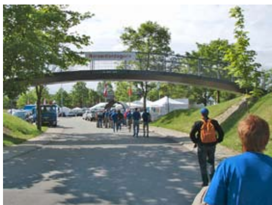
Ind i samlet flok

Vi var klar til åbningstalen af Miljøministeren, men ak hun kom ikke, så der var ingen åbningstale! Synd for dem, der var stået op midt nat for at komme over til en aflysning.